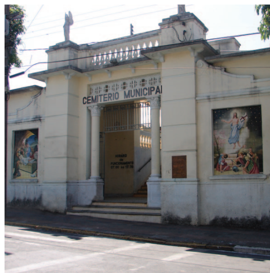
Entrada principal do Cemitério Municipal

No dia de visitas, as famílias costumam enfeitar os túmulos com flores, por isso a Prefeitura pede que sejam levadas flores de plástico, para evitar a proliferação do mosquito da dengue. Os vasos devem ser completados totalmente com terra e furados, para escoamento da água.