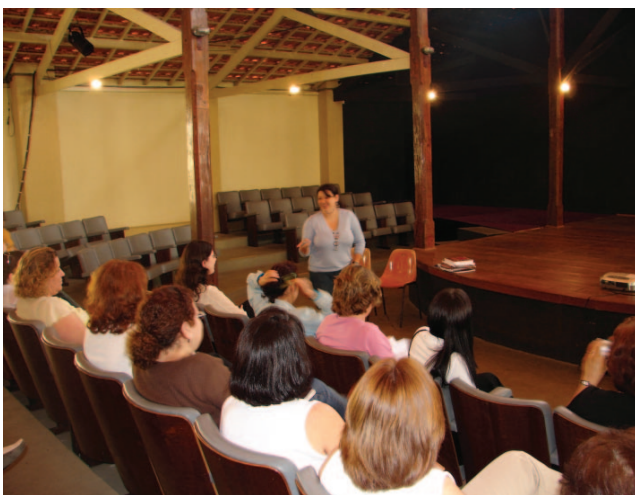
A reunião abordou programas de geração de renda e economia solidária

Profissionais de saúde mental dos municípios vinculados à Dir-XII se reuniram, na quinta-feira, 19, no Centro Cultural em Socorro, para apresentar novas propostas que podem ser adotadas nos serviços de saúde mental da região.