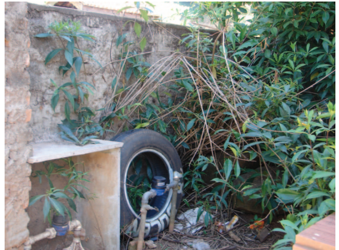
Armadilha situada nas proximidades da Rua Voluntários da Pátria

da dengue são febre alta; dor de cabeça, nos ossos e no fundo dos olhos; manchar avermelhadas pela pele; vômitos e diarreia. Os sintomas pode ser confundidos com uma gripe.