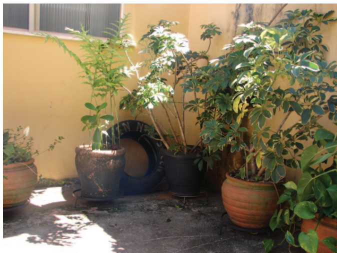
Armadilha para dengue colocada no Posto de Saúde Central

Com a chegada do verão, a equipe da Vigilância Epidemiológica do município intensifica os trabalhos de conscientização da população e cerco ao mosquito transmissor da doença, o Aedes Aegypti .