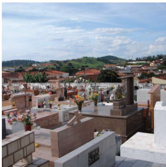
O cemitério deve receber cerca de 5 mil pessoas durante o Finados

O Cemitério Municipal está passando por uma série de modificações que objetivam a melhoria de sua estrutura e prestação de serviços, como inclusão de pinturas, reformas das ruas e construções, entre outros.