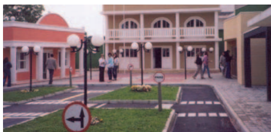
Vista da Cidade Mirim da OPET

O 2º Fórum Nacional de Gestão Pública Educacional da Opet discutiu temas relacionados à cidadania e à geração de riquezas econômicas, com base em planejamento estratégico. O evento aconteceu nos dias 05 e 06 de outubro, em Curitiba (PR), e contou com a participação da Chefe do Serviço de Ensino Municipal, a Supervisora do Serviço de Creche, a diretora da EMEF Profª Esther de Camargo Toledo Teixeira e a diretora da Creche Municipal Betania.