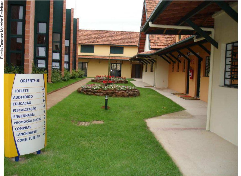
Vista interna do Centro Administrativo Municipal

Estão instalados no novo complexo os gabinetes do Prefeito, Vice-Prefeito e Secretaria; os Deptos. Administrativo, Jurídico, Financeiro, Educação, Promoção Social, Comunicação Social e Desenvolvimento Econômico; as Divisões de Tributação, Tesouraria, Protocolo, Dívida Ativa, CPD, Fiscalização, Licitação, Engenharia, Pessoal, Compras, Vigilância Sanitária, Fundo Social e Guarda Municipal. Leia a reportagem completa na pág. 06.