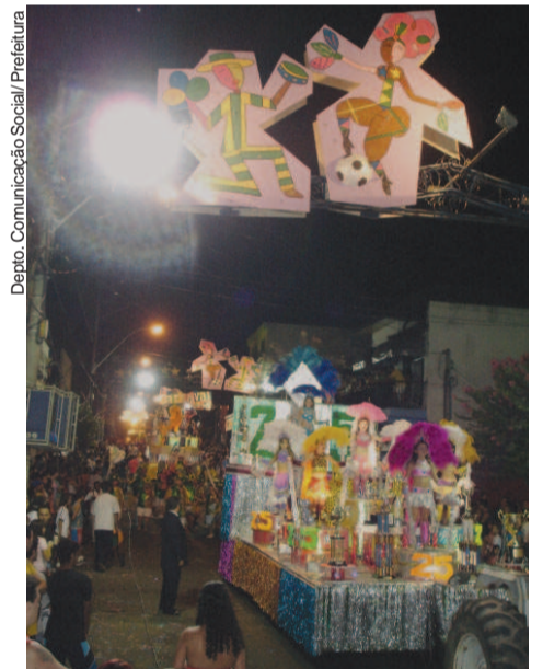
Em 2006, Socorro teve o carnaval "Vai Brasil"

O tema é livre e qualquer pessoa interessada pode enviar sua proposta, que será analisada pela Comissão de Carnaval e, em seguida, comunicada aos participantes.