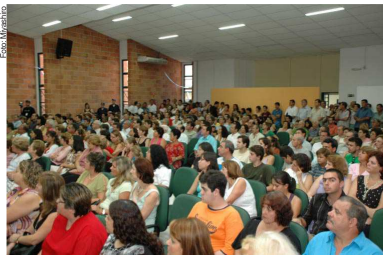
O auditório ficou lotado durante a cerimônia de inauguração

Emocionado em seu discurso, realizado paralelamente a uma projeção de slides com fotos que retrataram os principais feitos de sua administração, o prefeito municipal lembrou as inúmeras dificuldades encontradas logo que assumiu seu primeiro mandato. Ao realizar um balanço de seu mandato, enumerou as mais diversas conquistas obtidas por sua administração em todos os setores, e ressaltou o valor do orçamento anual de Socorro, hoje triplicado e atingindo a casa dos R$ 36 milhões. Afirmou que a população deve continuar a ser administrada por pessoas honestas e responsáveis, que respeitem o povo.