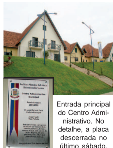
Entrada principal do Centro Administrativo. No detalhe, a placa descerrada no último sábado.

seguintes dizeres: "Esta obra retrata o progresso alcançado por nossa cidade. Embora grandiosa, temos a certeza de que, com a ajuda de Deus e do povo, ela será pequena para o futuro que pretendemos alcançar". O evento foi encerrado com o show da Banda Impacto Total.