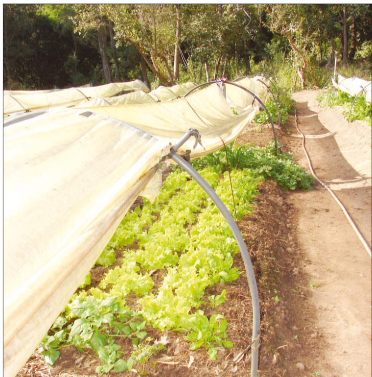
Horta feita no sistema de túnel, onde os agricultores aplicaram as técnicas de produção orgânica ministradas durante o curso

O projeto De Olho nos Rios tem o objetivo de recuperar e conservar as bacias hidrográficas e entre as ações estão a realização de estudos e levantamentos de áreas degradadas, oferta de cursos e oficinas de capacitação ambiental e incentivo na formação de grupos de jovens nos bairros da zona rural para a manutenção da microbacia.