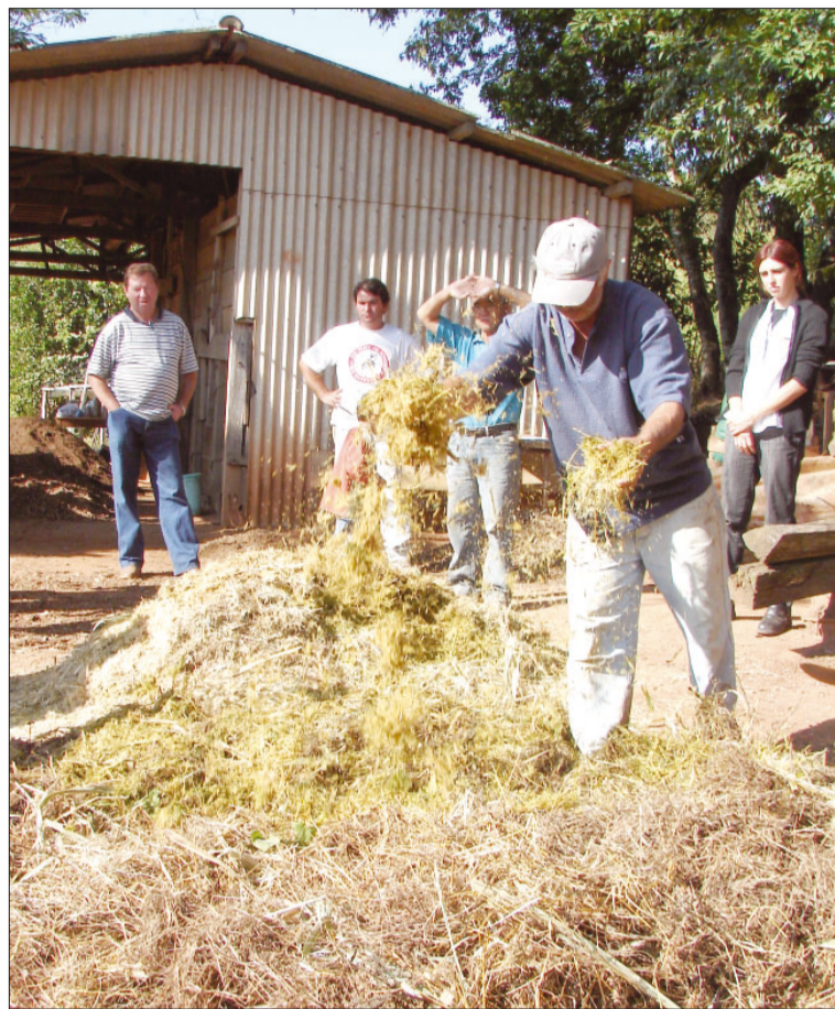
Produtores aprenderam na prática como fazer a compostagem orgânica utilizada juntamente com o adubo orgânico na plantação

Outra técnica ensinada durante o curso foi o bokashi, um adubo orgânico utilizado para tratar a terra, juntamente com a compostagem orgânica, feito com terra, farelos, cama de frango ou outro esterco disponível na propriedade, cinza, pó de carvão, açúcar e amido de milho. "A grande vantagem é que podem ser utilizados todos os resíduos da