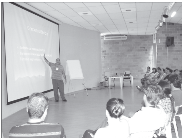
O palestrante ofereceu uma série de informações para administração das empresas ligadas ao turismo de aventura

Os módulos do curso abordaram aspectos de gestão empresarial;