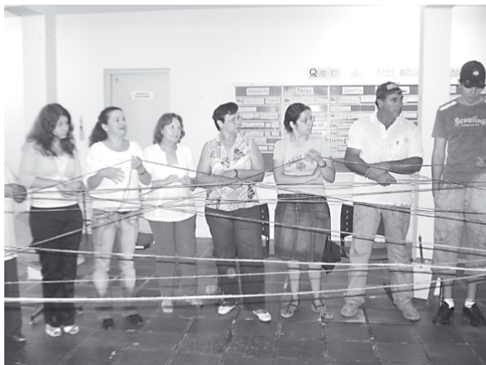
Familiares dos usuários durante a dinâmica do barbante

O próximo encontro foi marcado para o fim do mês de novembro, também na sede do Caps.