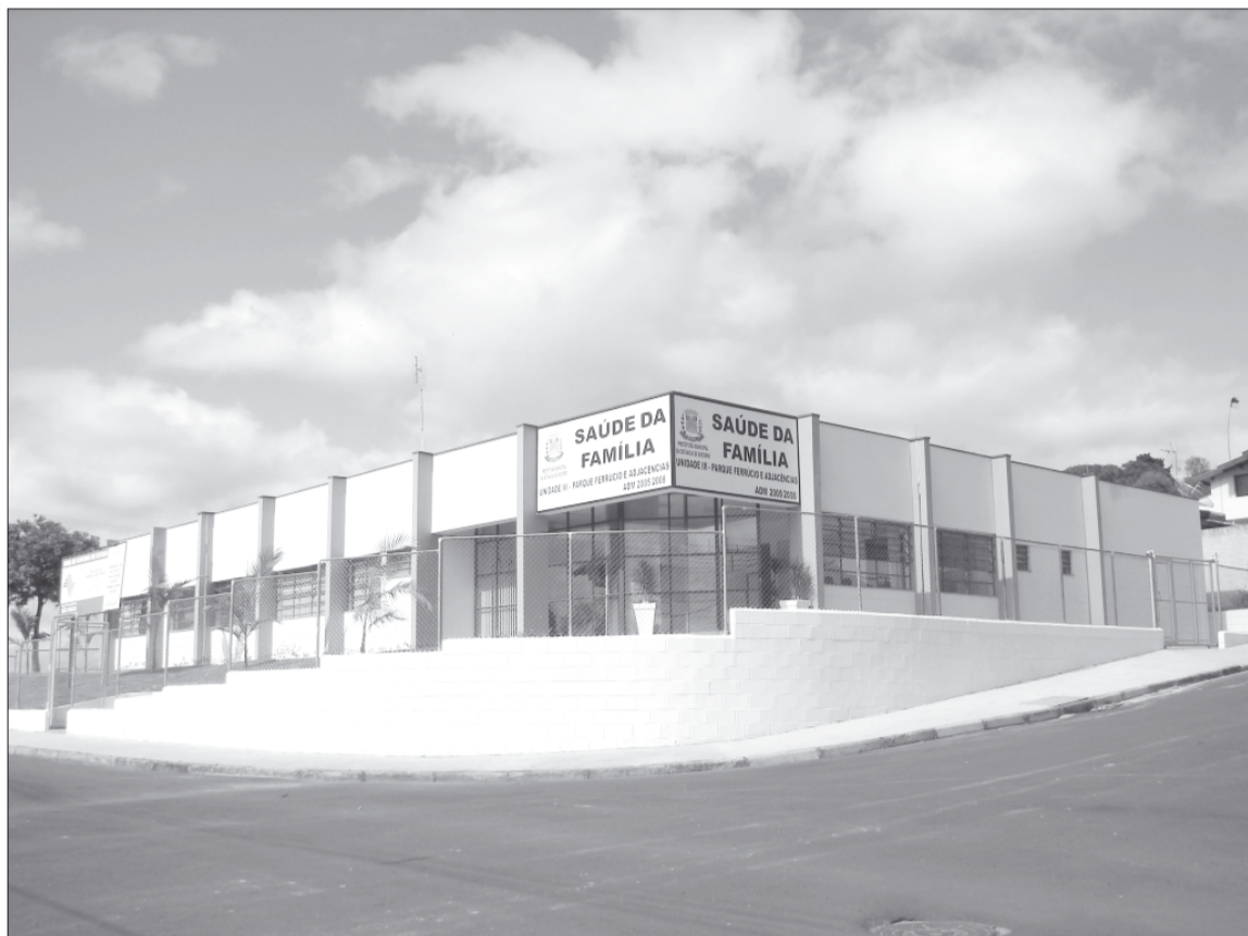
Unidade do PSF Parque Ferrúcio, recém-inaugurada. Um dos investimentos na saúde que beneficia a população de três bairros

A área da saúde é uma das prioridades da atual administração, que se propõe a investir no setor por meio de aquisição de equipamentos, contratações, melhorias das estruturas físicas e da prestação de serviços à população. Na audiência pública realizada na quarta-feira, 5, na Câmara Municipal, os cidadãos tiveram a oportunidade de constatar as principais ações do setor.