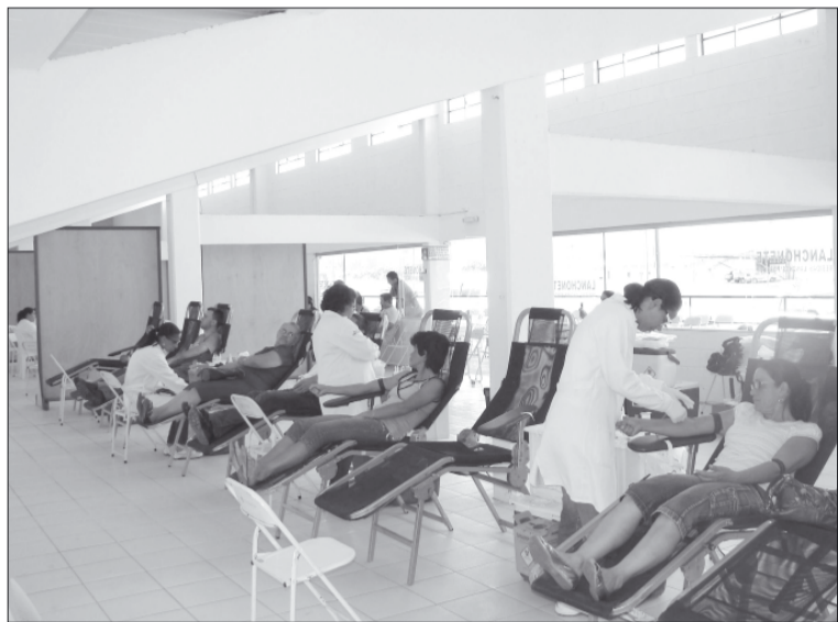
Voluntários durante a coleta, no Centro de Exposições

A segunda campanha de doação de sangue organizada pelo Hemocentro da Unicamp, em Socorro, contou mais uma vez com a adesão da população, sendo contabilizada a participação de 109 candidatos.