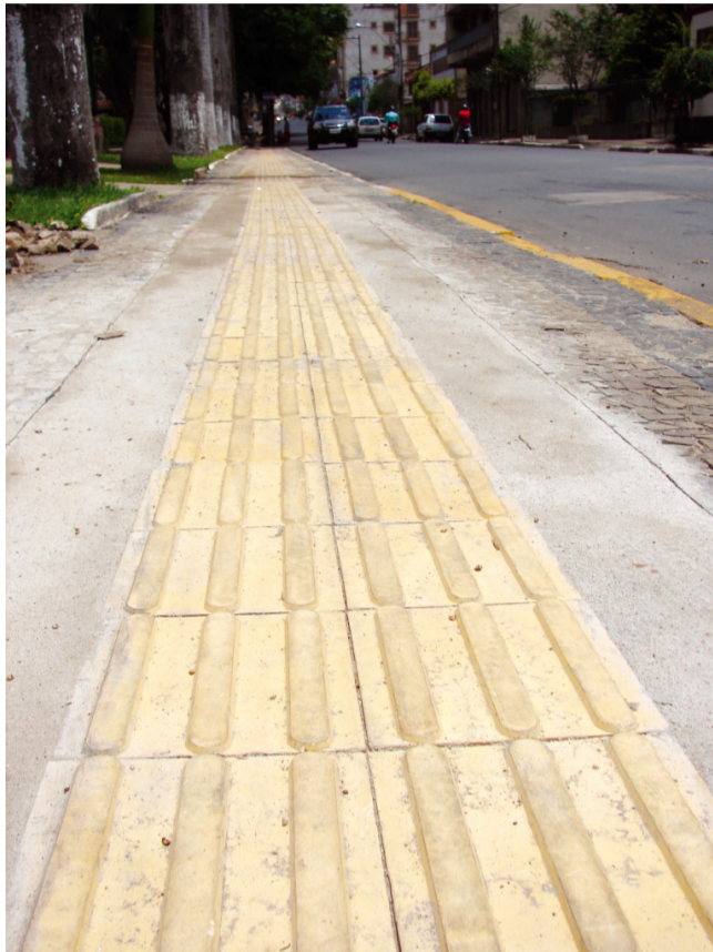
Trecho concluído da Avenida XV de Novembro, em frente ao Museu Municipal

O piso direcional é formado por barras paralelas e orienta o deslocamento de pessoas com deficiência visual ou baixa-visão. Já o piso de alerta é formado por pequenos troncos de cones, e serve como alerta para mudanças de direção, desníveis e na proteção de