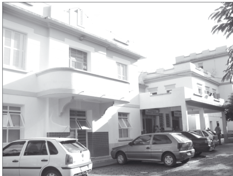
Hospital Dr. Renato Silva, que passou a contar com apoio da Prefeitura

cumprir sua função de distribuir medicamentos para a população. Nos trimestres foram mais de um milhão de comprimidos e quase 12 mil frascos de medicamentos. O serviço somou 1.142.939 medicamentos distribuídos para a população.