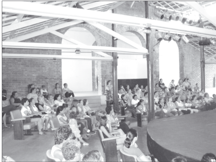
A palestrante ofereceu dicas para manter uma boa higiene bucal

A dentista iniciou o encontro explicando um pouco sobre como funciona o serviço odontológico municipal e a evolução do trabalho realizado pelos profissionais da rede nos últimos 20 anos, principalmente com o avan-