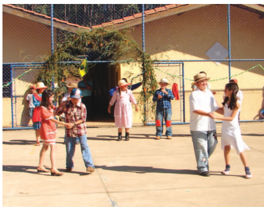
EMEF Bairro Pinhal

Nos últimos dias 12 e 13 aconteceu a festa junina da EMEF Rio do Peixe e das EMEIs Rio do Peixe e Bairro da Lagoa. As EMEFs Bairro Currupira, Pinhal e Lavras de Cima; além das EMEIs Pinhal e Camanducaia também já festejaram.