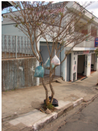
Rua Cel. Fidelis Domingues

A Prefeitura Municipal da Estância de Socorro, através do setor de Supervisão de Limpeza Pública, está intensificando a fiscalização