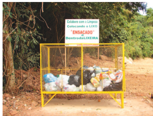
Lixeira instalada no Bairro dos Cubas

Atualmente, o serviço de coleta vem sendo realizado principalmente no período da manhã, dividido por bairros, dias e horários. A coleta compreende o lixo doméstico, devendo o recolhimento de entulhos ser destinado a empresas especializadas, que devem ser contratadas pelo particular interessado. Pequenos volumes de podas de jardim (ensacados) podem ser recolhidos pela municipalidade, desde que comunicados previamente à Supervisão de Limpeza Pública, que informará qual o