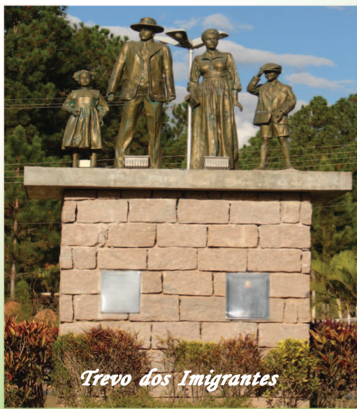
Trevo dos Imigrantes