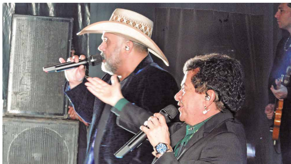
Show da dupla Rionegro & Solimões

As apresentações, desfiles e shows transcorreram sem ocorrências graves. A segurança pública foi desempenhada pela Guarda Civil Municipal, com apoio de empresa terceirizada para o evento.