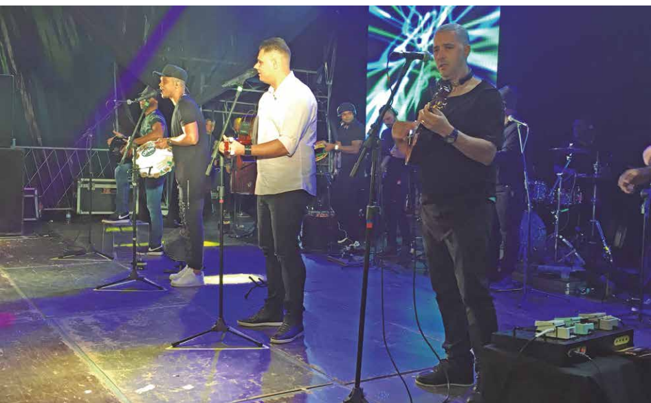
Show do grupo Exaltasamba